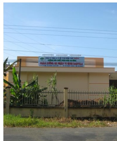
Phân xưởng sản xuất phân vi sinh Dasvila

Theo hướng phát triển của Công ty Dasco, sản phẩm phân vi sinh cùng các sản phẩm phân bón hữu cơ sinh học và thuốc BVTV sẽ có mặt ở mọi miền đất nước, góp phần tăng năng suất lúa, các loại cây trồng, cây công nghiệp, phục vụ phát triển kinh tế nông nghiệp và đẩy mạnh xuất khẩu. Mỗi năm Công ty sẽ cung cấp 1 triệu lít phân vi sinh Dasvila đáp ứng nhu cầu cho nông dân tỉnh Đồng Tháp và các khu vực lân cận. Và định hướng phát triển đến năm 2010 Công ty sẽ xây dựng nhà máy sản xuất với quy mô lớn hơn để đáp ứng nhu cầu của bà con nông dân khắp các tỉnh trong cả nước.